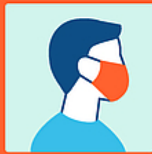
Usare la mascherina