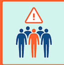
Evitare luoghi affollati