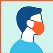
Usare la mascherina