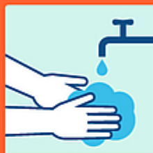
Lavarsi le mani