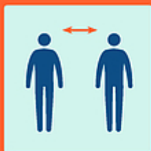
Tenersi a distanza

Valutiamo le situazioni e rispettiamo le regole