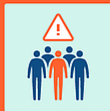
Evitare luoghi affollati