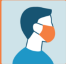
Usare la mascherina