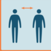
Tenersi a distanza