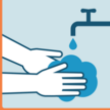
Lavarsi le mani