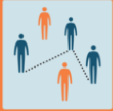
Limitare i contatti personali

Stato 21.10.2020 DISTANTI MA VICINI PROTEGGIAMOCI INSIEME