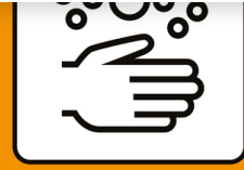
Gründlich Hände waschen.