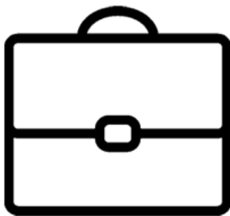
Wirtschaft, Arbeitgeber, KMU