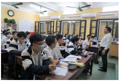
Hải Phòng tổ chức cho học sinh học qua truyền hình trong đợt nghỉ phòng chống dịch COVID-19