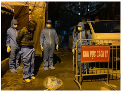
Hà Nội: Cách ly con ngõ ở đường Cầu Giấy nơi HDV du lịch sinh sống