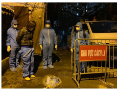
Hà Nội: Cách ly con ngõ ở đường Cầu Giấy nơi HDV du lịch sinh sống