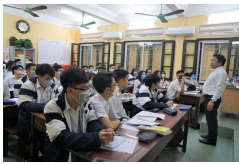
Hải Phòng tổ chức cho học sinh học qua truyền hình trong đợt nghỉ phòng chống dịch COVID-19