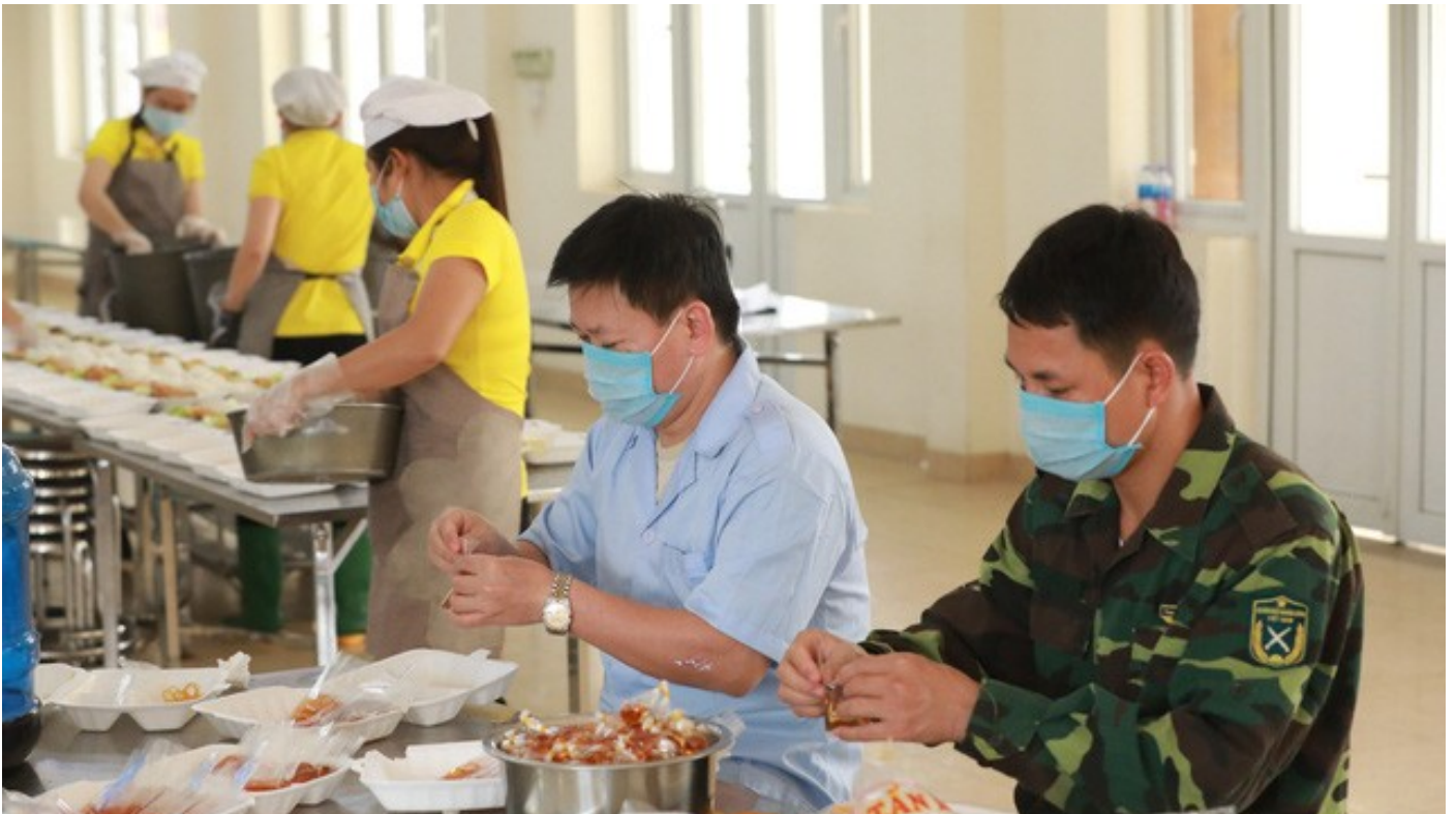
ẢNH: Bữa cơm trong khu cách ly COVID-19