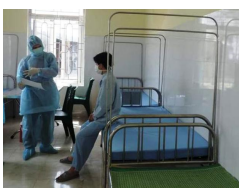
Thanh Hóa: 6 trường hợp âm tính với COVID-19