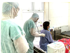
Kết quả xét nghiệm những người tiếp xúc gần với nữ du học sinh nhiễm COVID-19

Thêm một nữ bệnh nhân người Việt đang điều trị ở Bệnh viện Bệnh nhiệt đới Trung ương cơ sở 2 phải thở máy, lọc máu.