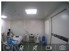
Thông tin mới nhất về sức khỏe các bệnh nhân mắc COVID-19 ở TP.HCM