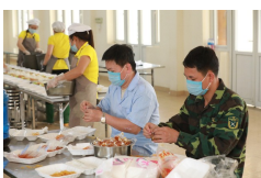
ẢNH: Bữa cơm trong khu cách ly COVID-19