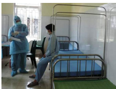
Thanh Hóa: 6 trường hợp âm tính với COVID-19