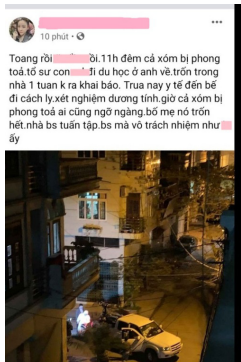
Phao tin thất thiệt, miệt thị người bị cách ly, 1 chủ tài khoản bị phạt 7,5 triệu đồng