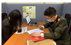
Cô gái tung tin gây hoang mang về BN17 dương tính với COVID-19 bị triệu tập