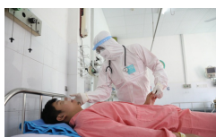
BN18 - nam thanh niên trở về từ Daegu, Hàn Quốc - dự kiến ra viện ngày mai