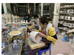
Làng gốm Bát Tràng yên bình giữa mùa dịch COVID-19