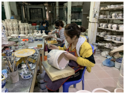
Làng gốm Bát Tràng yên bình giữa mùa dịch COVID-19