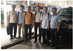
Các bác sĩ Bệnh viện Chợ Rẫy lại tức tốc lên đường trong đêm đến Tây Ninh