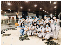
Bệnh viện Bạch Mai: Chúng tôi không đơn độc trên mặt trận chống dịch COVID-19