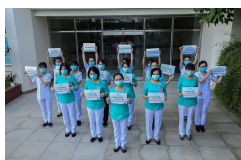
Bác sĩ lan tỏa thông điệp của ngành Y để chung tay chống COVID-19

Nam sinh viên nhường phòng, để lại đồ ăn cho người cách ly, nữ sinh viên vận động quyên góp ủng hộ để chống dịch, hay bức thư viết tay của nữ du khách nước ngoài về tấm lòng người Việt... Đó là một trong số nhiều câu chuyện đẹp trong khu cách ly thời chống dịch bệnh COVID-19.