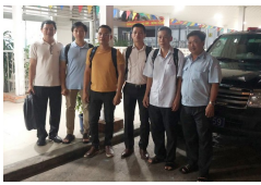
Các bác sĩ Bệnh viện Chợ Rẫy lại tức tốc lên đường trong đêm đến Tây Ninh