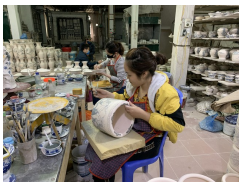
Làng gốm Bát Tràng yên bình giữa mùa dịch COVID-19