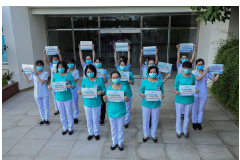
Bác sĩ lan tỏa thông điệp của ngành Y để chung tay chống COVID-19

Nam sinh viên nhường phòng, để lại đồ ăn cho người cách ly, nữ sinh viên vận động quyên góp ủng hộ để chống dịch, hay bức thư viết tay của nữ du khách nước ngoài về tấm lòng người Việt... Đó là một trong số nhiều câu chuyện đẹp trong khu cách ly thời chống dịch bệnh COVID-19.