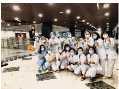
Bệnh viện Bạch Mai: Chúng tôi không đơn độc trên mặt trận chống dịch COVID-19