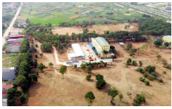
Hình ảnh BV dã chiến Mê Linh được cải tạo "thần tốc" nhìn từ flycam