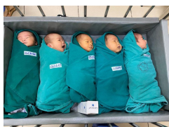
5 công dân tí hon chào đời trong "ổ dịch" giữa trung tâm Thủ đô

Việt Nam đã bước sang ngày thứ 7 thực hiện các biện pháp giãn cách xã hội và liên tiếp 3 buổi sáng (5-7/4) không có ca mắc mới COVID-19. Các biện pháp ứng phó với dịch COVID-19 của Việt Nam đang cho thấy hiệu quả. Tuy nhiên, dịch bệnh đang trong giai đoạn nguy hiểm, có thể bùng phát bất cứ lúc nào. Vì vậy, cần phải tiếp tục thực hiện nghiêm Chỉ thị 16 về cách ly xã hội, để giữ vững thể chủ động chống dịch.