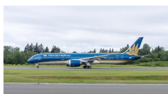
Hàng không giới hạn khách bay trên mỗi chuyến chặng Hà Nội - TP.HCM