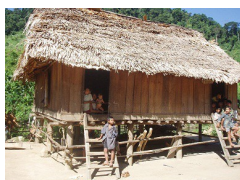
Gần 20 người dân tộc Mày bỏ bản trốn vào rừng vì sợ dịch COVID-19