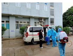
Thanh Hóa: Thành lập các tổ phản ứng nhanh để điều trị bệnh nhân COVID-19

Trong ba tháng qua, cả nước đã khẩn trương vào "cuộc chiến" với đại dịch COVID -19 và đã đạt được những kết quả bước đầu quan trọng. Tính đến ngày 8/4, Việt Nam có 251 ca mắc bệnh, trong đó có 122 người đã khỏi bệnh. Điều đặc biệt, Việt Nam là một trong ba nước tại khu vực Đông Nam Á chưa có ca nào tử vong. Cả nước đang bước vào giai đoạn quyết định nhằm đánh bại đại dịch với tinh thần và ý chí Việt Nam