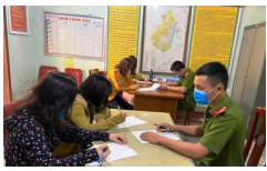
Nghệ An: Tụ tập "buôn chuyện", 4 phụ nữ bị phạt