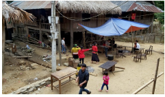
Nghệ An: UBND huyện Tương Dương vào cuộc vụ tổ chức ăn vía linh đình tại bản vùng cao trong mùa dịch COVID-19