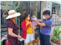
Những chuyến xe 0 đồng của chàng shipper Sài Gòn

Dù hết ngày 22/4 mới chính thức hết hạn cách ly xã hội, nhưng ghi nhận tại nhiều tuyến phố, nút giao trên địa bàn Hà Nội đã xảy ra hiện tượng ùn ứ, thậm chí tắc đường.