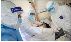
Phi công Vietnam Airlines mắc COVID-19 từng phản ứng miễn dịch dữ dội, rất nguy kịch nay ra sao?