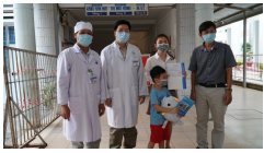
Bé 6 tuổi mắc COVID-19 được công bố khỏi bệnh