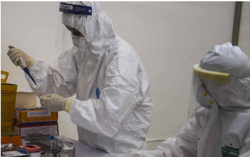
Cô gái Đan Mạch di chuyển khắp Việt Nam trước khi phát hiện mắc COVID-19 đã khởi bệnh