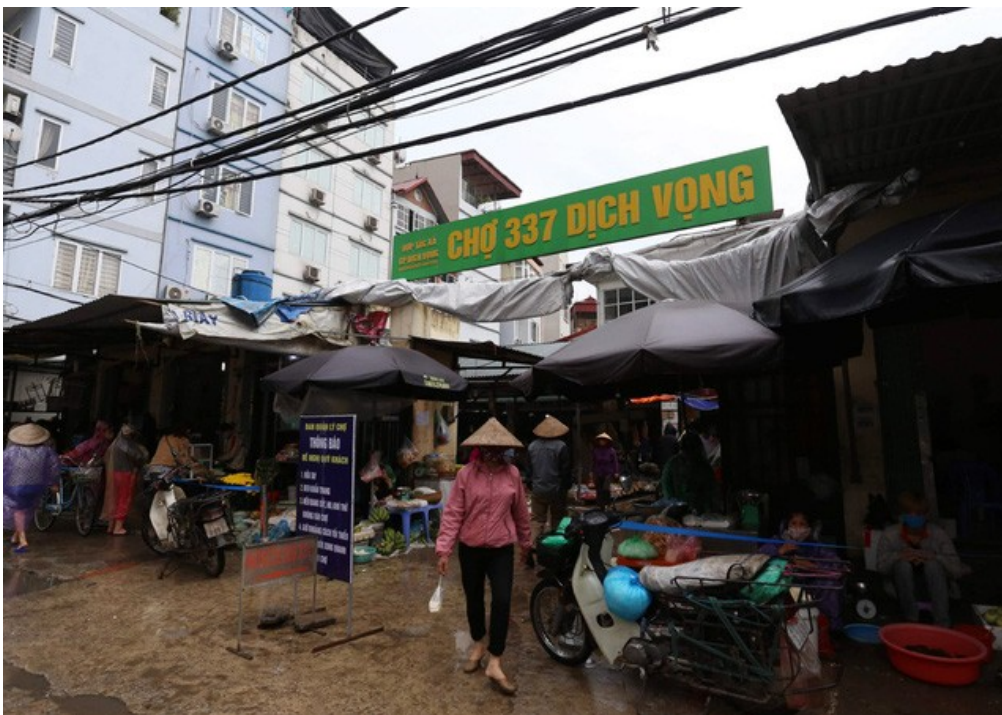
Hà Nội vẫn chống dịch rất "căng" ở các chợ dân sinh