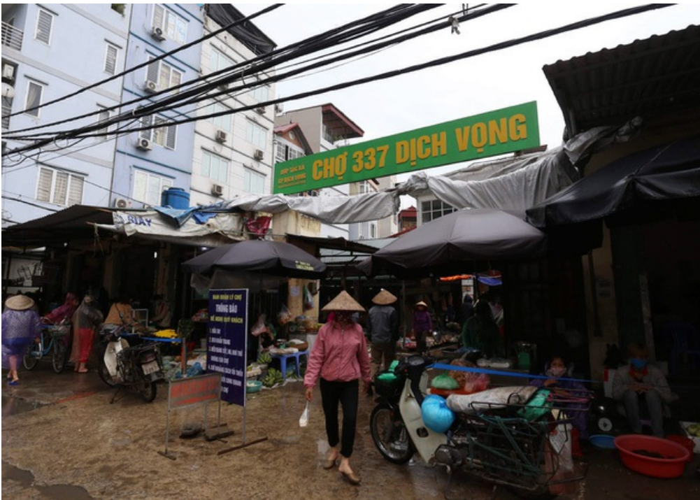
Hà Nội vẫn chống dịch rất "căng" ở các chợ dân sinh