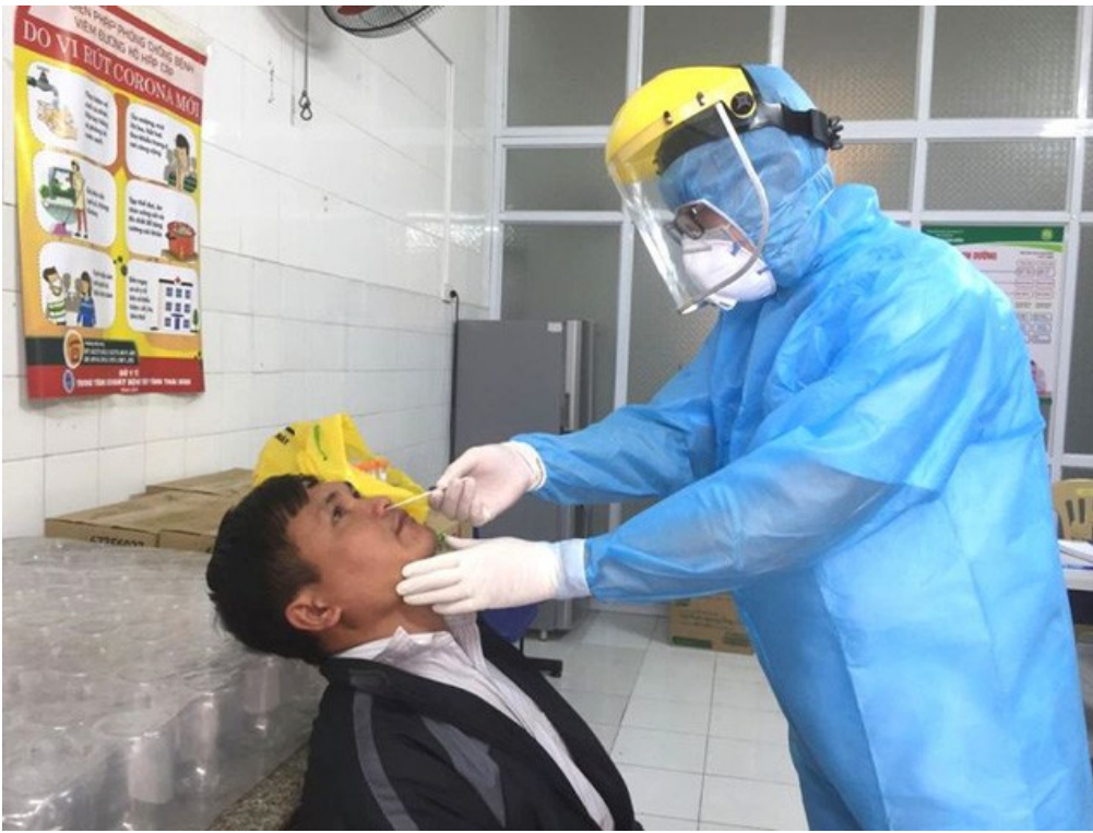
Đã có kết quả xét nghiệm 41 trường hợp tiếp xúc trực tiếp với 2 du học sinh từ Nhật Bản về mắc COVID-19