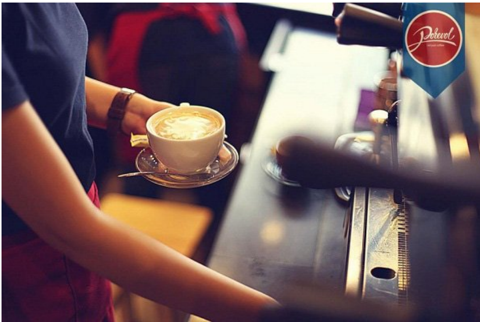
Hà Nội: Vẫn tạm ngừng dịch vụ giải trí; ngồi uống cafe phải cách 2m