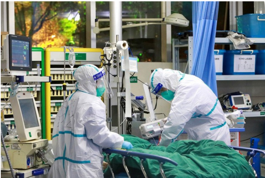
Tình trạng phổi của phi công nguy kịch vì COVID-19 cải thiện tốt